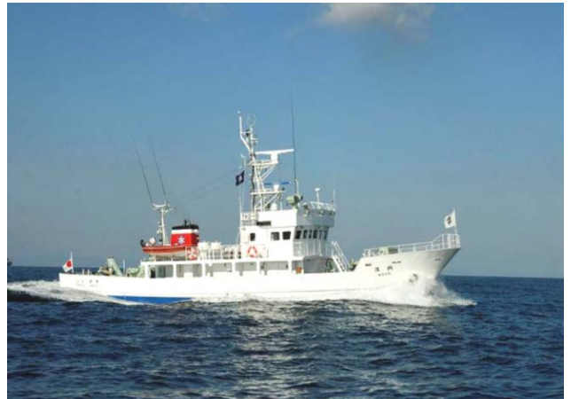
東京都漁業調査指導船「興洋」