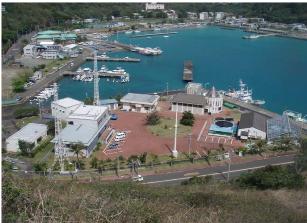
小笠原水産センター全景