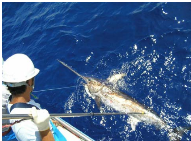
メカジキの生態調査