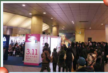
会場ビジョンにて、福島県主催「東日本大震災追悼復興祈念式」を放映