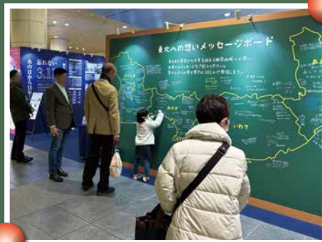
「応援メッセージボード」