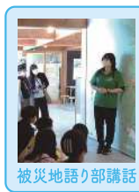
被災地語り部講話