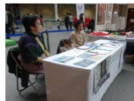
拉致問題署名活動