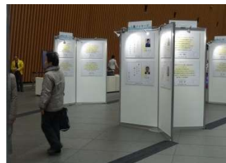
ギャラリーの様子