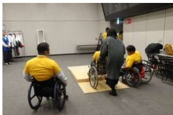
バリアフリー体験

世界には多くの国があり民族があります。そのことを体感していただくために、世界11か国の民族衣装を着ることができる体験会を実施しました。それぞれの民族や国の説明パネルで学びつつ、カラフルな民族衣装を着て写真を撮ったり、会場の外に散歩に出たりと、楽しんでいただきました。