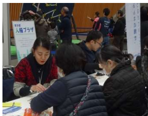
キーホルダー体験

高校生・著名人の人権メッセージや人権パネル展示、ミニシアター上映会を行いました。今年はパネルの並べ方を並列形からY字形にしたので、通り抜けしやすく、多くの方にご覧いただきました。また、ミニシアターはソファに座り休憩がてら見ていく方が多かったです。