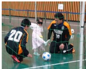
ブラインドサッカー