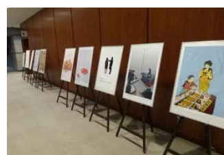
ポスターで伝える人権