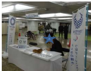
エンブレムパズル