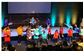
ドリームエナジープロジェクト

話していただくことで、いろいろな気づきを与えていただきました。感動と笑顔に会場は包まれました。