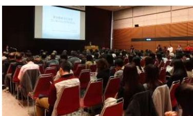
プレゼンコンテストの様子

D6ホワイエでは、同和問題など、様々な人権課題の啓発パネルを展示いたしました。また、D5ホワイエでは、美大生によるポスター展「ポスターで伝える人権」を行いました。美大生のポスターはイラストとコピーの内容がとても素晴らしく、多くの方から好評でした。(D5ホワイエは8日のみ開催)