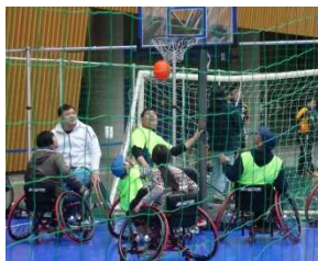
車いすバスケットボール

視覚障害の方が行うことを初めて知ったという方も多く、アイマスクをしてのボルダリング体験もしていただきました。