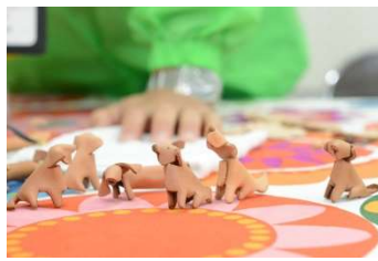
キーホルダー実物