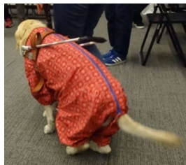
盲導犬への対応体験