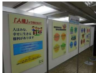
パネル展示の様子