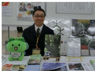
「人権の森」構想ブース

また、東京都が作成した人権啓発冊子やリーフレットを展示するとともに、多くの方に配布させていただきました。