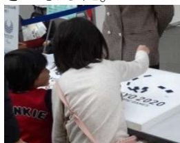
エンブレムパズル