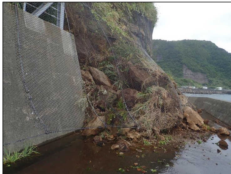
令和6年10月27日 土砂崩れ現場状況