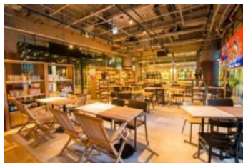
会場 離島キッチン日本橋店