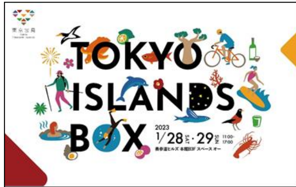
「TOKYO ISLANDS BOX」 キービジュアル