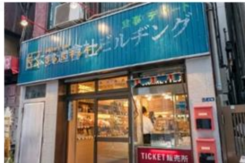
「るるぶキッチンビルディング」外観