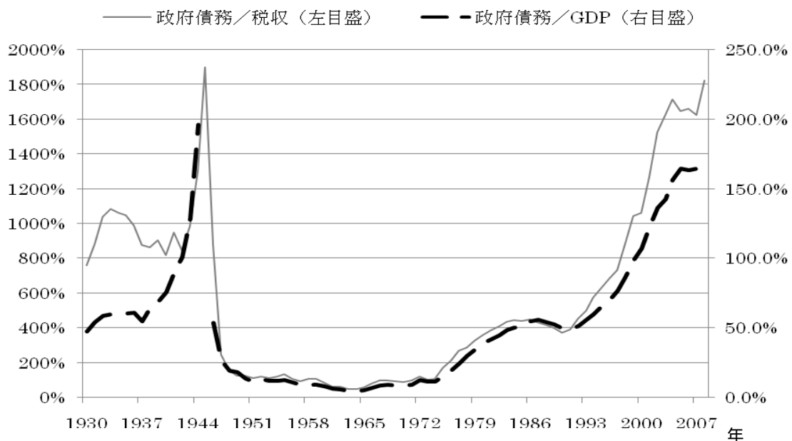
図 1 政府債務残高の対 GDP 比、対国税収入の推移 (1930 - 2008 年)

(注) GDP について、1979 年度以前は「平成 10 年度国民経済計算(平成 2 年基準・68SNA)」、1980～1998 年度は「平成 19 年度国民経済計算(平成 12 年基準・93SNA)」、1999 年度以降は、「平成 21 年 1 - 3 月期四半期別 GDP 速報(2 次速報値)」による。