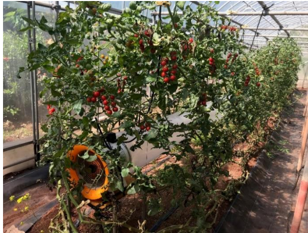
図1 株間へのダクト送風