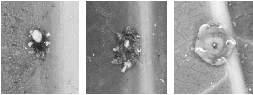
図1 ルビーロウムシ幼虫および成虫の殻の形態 (左図：1 齢後期～2 齢前期幼虫，中図：2 齢後期～3 齢幼虫，右図：3 齢幼虫～成虫)