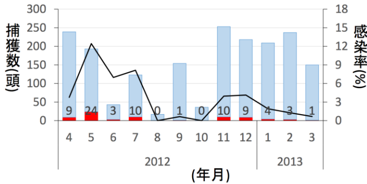
図1 ハスモンヨトウの捕獲個体数と感染個体数の年間推移（父島）