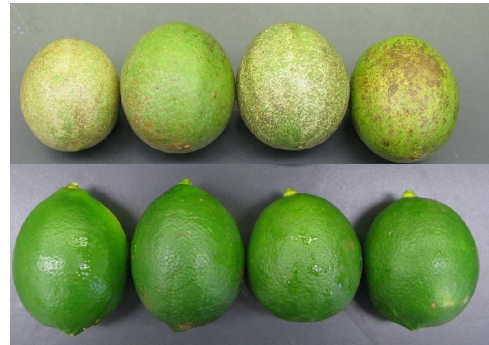
図2 リュウキュウミカンサビニによる菊池レモン果実の被害 (上段：被害果，下段：健全果)