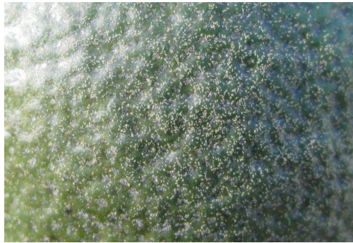
図1 菊池レモン果実表面に寄生した リュウキュウミカンサビダニ