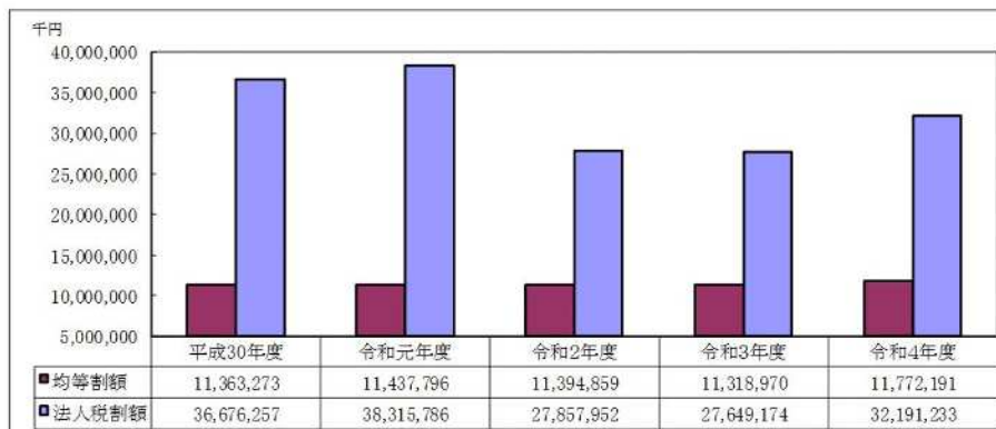
図－4 市町村民税法人均等割・法人税割の推移

図－4は、市町村民税法人均等割・法人税割の推移をグラフ化したものである。 法人均等割額について、令和2年度から減少傾向にあったが、令和4年度は増に転じた。 また、法人税割額についても、同様に令和4年度は増となった。