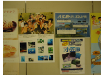
都庁32階の食堂付近

手づくりのホームページで、島の魅力や情報、支庁の取組を紹介しています。(URLは表紙に記載) 総務課庶務係 二二二二二