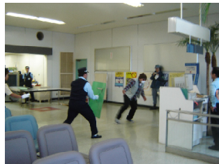
不法侵入対応訓練

を確保しながら不法侵入者の監視を行いました。管理事務所から連絡を受けた警察は、「不法侵入事案」に從つた的確な対応により、不法侵入者を取り押さえました。