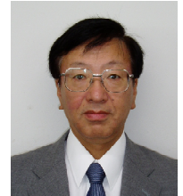
八丈支庁長 山手 秀雄