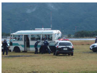
ハイジャック対応訓練

管理事務所は関係機関へ速やかに連絡し、対策本部を設置しました。ハイジャックされた航空機が到着、駐機した後、待機警察車両により航空機（マイクロバス）を包囲しました。警察が粘り強く犯人の説得を行い、ハイジャック犯を投降させました。