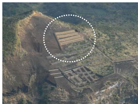
檜立保安林改良工事 (今年度は点線囲い部分)

底土野営場において防風林のための松の植栽工事、大賀郷園地では芝生広場整備を約3,000万円で行っています。 (次ページにつづく)