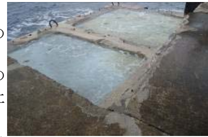
台風被害(八重根港)