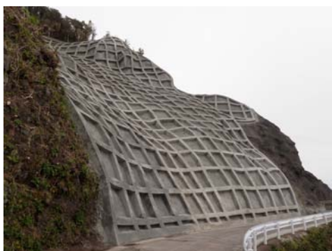
青ヶ島災害防除工事