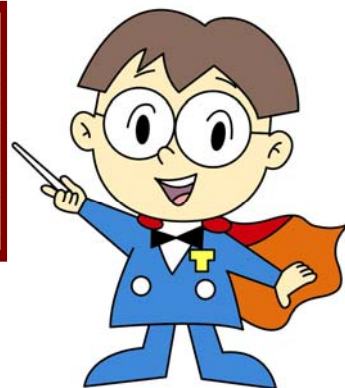
主税局イメージキャラクター タックス・タクちゃん