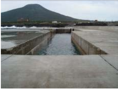
台風被害(八重根港)

泊地の整備、八重根漁港の防波堤整備等を行うとともに、中之郷漁港・洞輪沢漁港の各施設の補修工事を行いました。