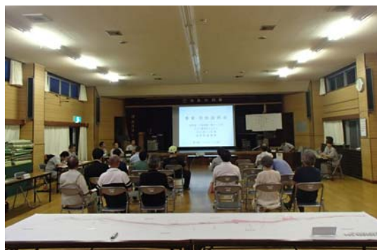
住民説明会の様子(末吉公民館にて)

整備予定区間は、一般都道八丈循環線(第215号)の「名古の展望台入り口」から「旧末吉小学校前交差点」までの約1.2km。現道は、幅が狭い(約5.6m)、歩道が無い、急なカーブがある等の問題を抱えています。これらの問題に対応するため、現道を活かしながら、幅を9mに拡幅、片側に歩道を設置するとともに、道路のラインを改良して、自動車・歩行者の安全を確保できるように整備を進めていく予定です。