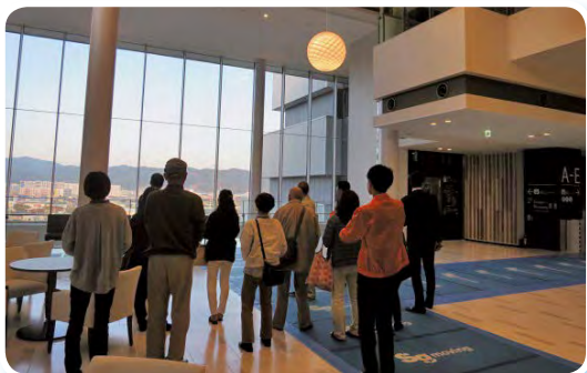
気仙沼市立新病院（気仙沼市）