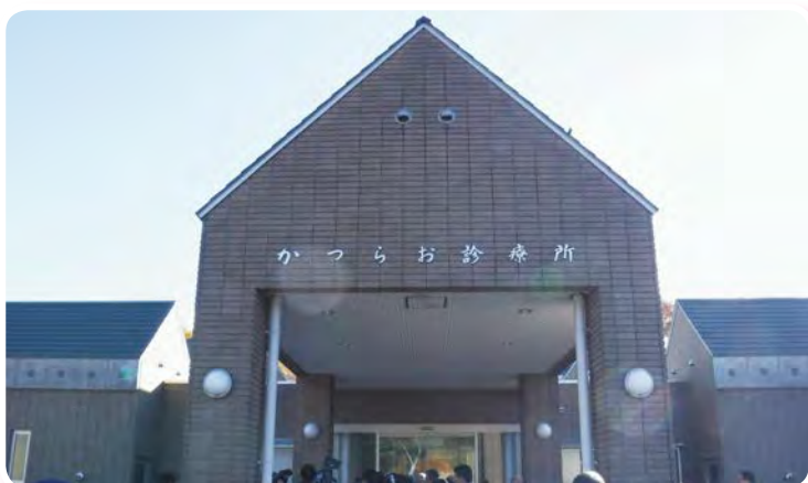
「葛尾村診療所」平成29年11月9日開設

私も、医療の面から福島復興のお役に立てるよう、引き続き努めていきたいと思えます。