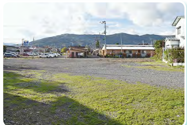
「穀町市営住宅」(遠野市)の建設予定地