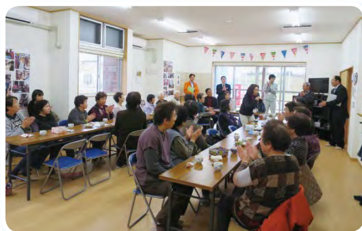
交流会（南三陸町宮志津川東復興住宅）