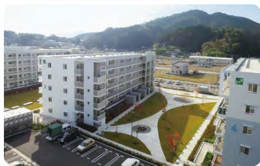
鹿折南住宅（気仙沼市）