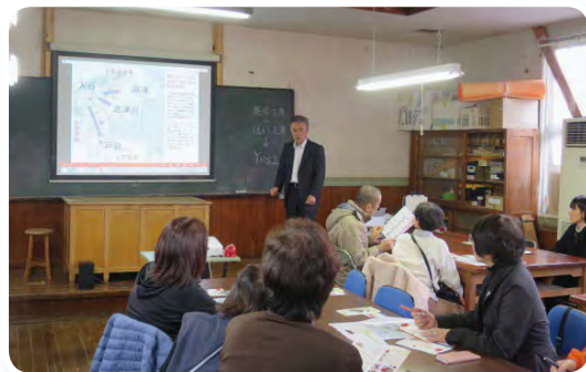
入谷Yes工房（南三陸町）