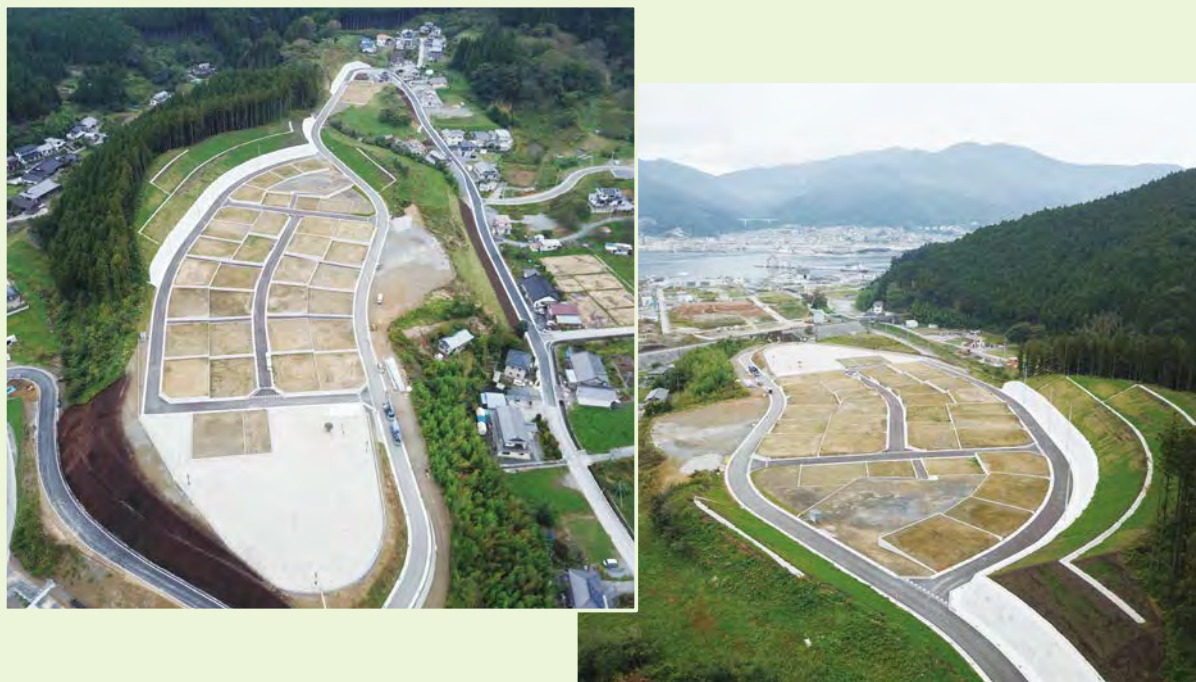
宅地造成工事が完了した「森っこ・洞川原」の宅地造成地

同市では、平成28年9月に全25団地計801戸の災害公営住宅の整備が完了しており、今回、住宅団地整備工事が完了したことから、住まいの再生に向け大きな節目を迎えることになりました。