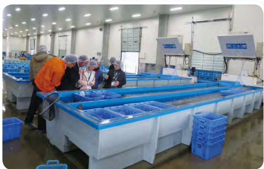
南三陸町地方卸売市場（南三陸町）