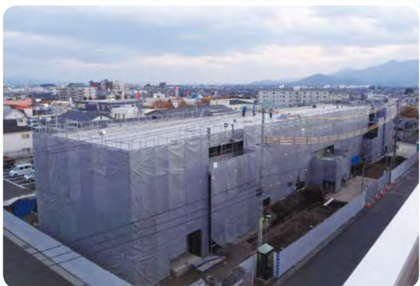
工事が進む「県営備後第1アパート」(盛岡市)