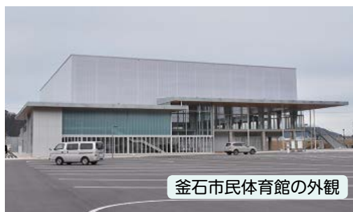
釜石市民体育館の外観