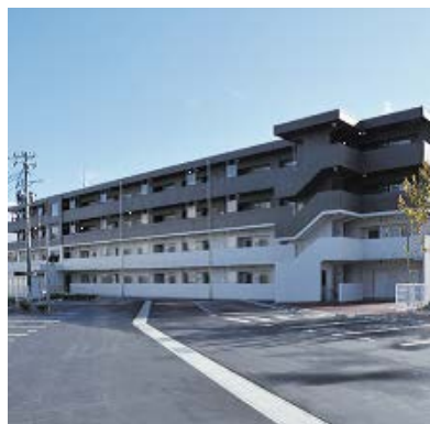
黒沢尻地区災害公営住宅：北上市

また、内陸部の北上市では、黒沢尻地区災害公営住宅34戸が11月に完成しました。整備に当たっては、入居予定者の意見交換会を開催し、入居者同士が顔を合わせる機会を設けることで、入居後の暮らしが円滑に始められるよう工夫がなされました。