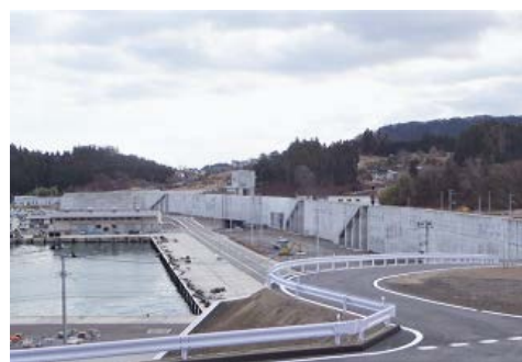
長部漁港海岸：陸前高田市

海岸保全施設では、昨年11月に山田町の織笠漁港海岸防潮堤1.4km、12月に陸前高田市の広田漁港海岸防潮堤1.1kmと長部漁港海岸防潮堤0.7kmの計3か所が完成しました。防潮堤には、消防団員の安全を確保するため津波注意報等の受信により陸こう部の門扉が自動で閉鎖できるシステムが備え付けられ、順次運用が開始されています。