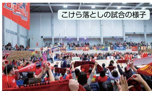
こけら落としの試合の様子