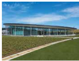
みやぎ東日本大震災津波伝承館 / 宮城県