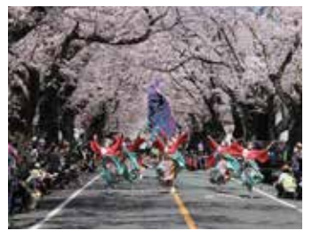
夜ノ森の桜 / 福島県