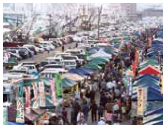
館鼻岸壁朝市 / 青森県