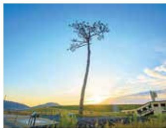
奇跡の一松 / 岩手県