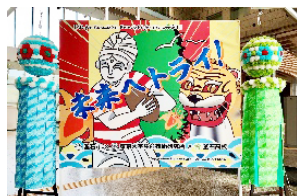
▲岩手県の大漁旗と宮城県の七夕飾り