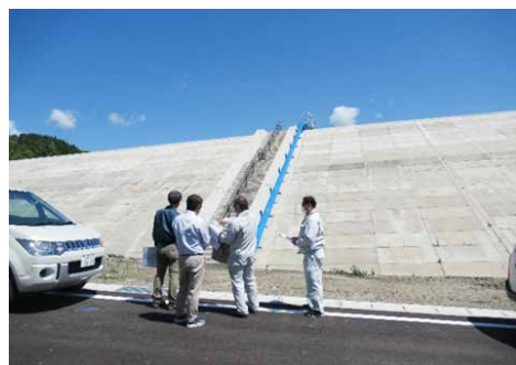
釜石市の現場視察(岩手県)