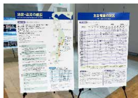
▲TMCでの復興パネル展示