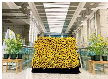
▲福島県産のひまわりの装飾