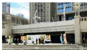
◀都内イベントでの 舞台装飾にも使用