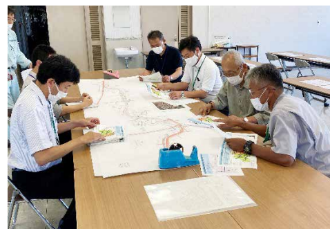
地元住民への事業説明会(福島県)