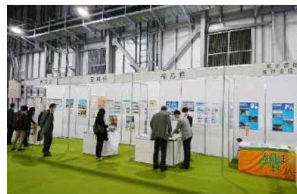
▲危機管理産業展でのブース出展