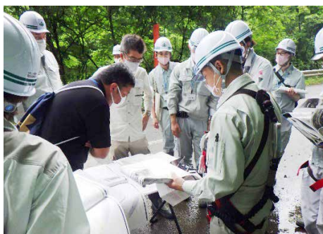
災害復旧事業の現地検査(宮城県)