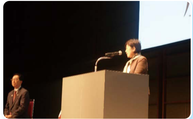
小池都知事の挨拶

ステージイベントでは、小池都知事が東京2020オリンピック・パラリンピック競技大会に触れ、「被災地の復興なくして大会の成功はない。被災地のニーズをしっかりと伺