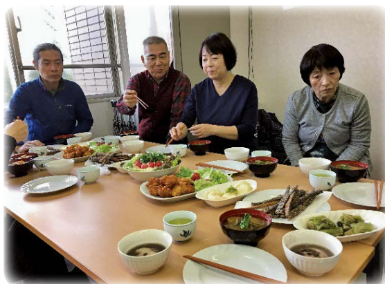
楽しいおしゃべり&ビンゴ大会