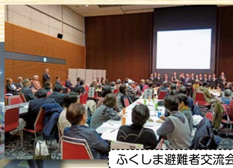
ふくしま避難者交流会