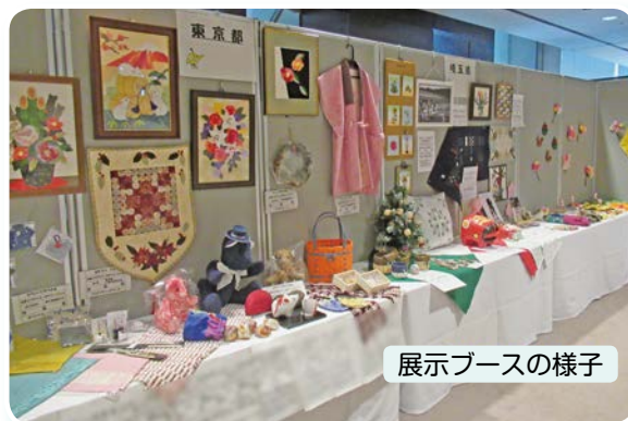
展示ブースの様子