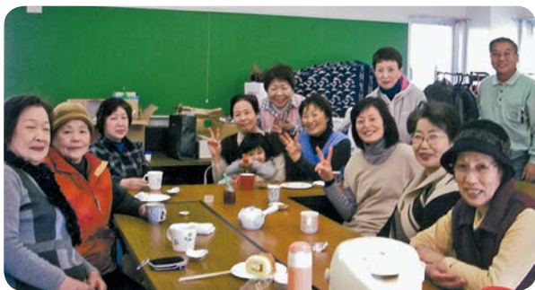
笑顔が素敵な皆さん♪話しがはずみました。

今後も避難者の方々が安心して立川で生活ができるよう、関係機関と連携しながら支援に取り組んでいきます。