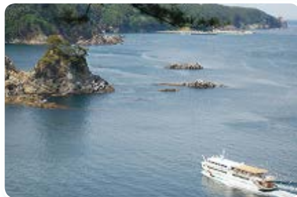
みちのく潮風トレイルのルートに含まれる景勝地 写真左：北山崎(田野畑村) 写真右：浄土ヶ浜(宮古市)