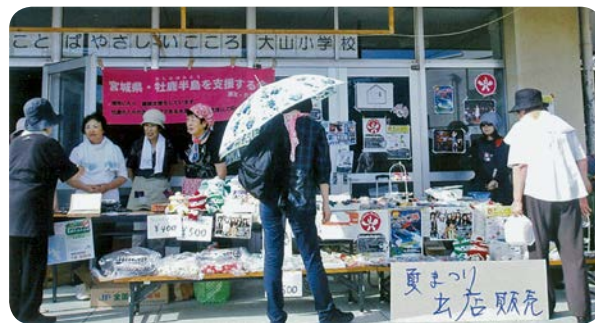
手作り品を地域の夏祭りに出店しました。

生活されている地域のことや、様々なサービスなどの相談窓口となる担当職員を配置しています。