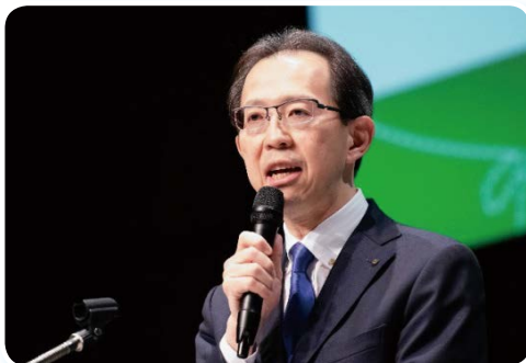
内堀県知事の挨拶

また、内堀福島県知事が「今、8年経とうとしているが、東北の復興は着実に前に進んでいる。懸命に進むその姿を皆さんに今日のフォーラムを通じて、感じていただければありがたい。」と挨拶しました。小池知事は、内堀福島県知事やいわき市出身で女優の武田玲奈さんとトークセッションを行い、東北の魅力や被災地と東京のつながりを語り合いました。