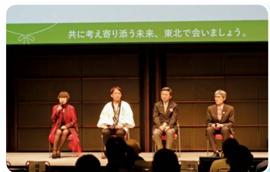
被災地支援の取組紹介

ステージイベントの他にも、東北4県の県産品の販売や被災地の文化を体験できるワークショップなどが行われるとともに、地上広場で