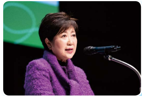
小池都知事の挨拶

ステージイベントでは、小池都知事が「東京は、東北に支えられて発展をしてきたということを忘れないで、思い起こしていく。今日はそのような日としていきたい。」と挨拶をしました。