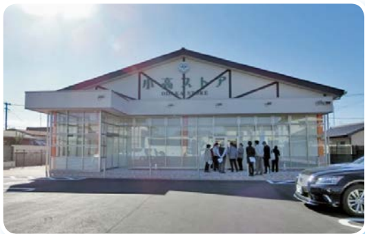
南相馬市内（小高ストア）視察

平成30年11月14日(水)から15日(木)に、ふるさと復興の今がわかるツアー【福島県北部コース】を実施し、南相馬市、浪江町、富岡町内で、県や自治体職員等からご説明いただき、ふるさとの復興の様子をご覧いただきました。南相馬市では、風力発電機や、視察時はオープン直前の小高ストア等、市内を視察したほか、復興公営住宅・牛越団地を視察しました。浪江町では、大平山霊園、請戸漁港、まち・なみ・まるしえなどを視察しました。富岡町では、ふたば医療センター附属病院、リプルンふくしま（特定廃棄物埋立情報館）を視察しました。参加者の方からは、今後の生活先の医療・住居の参考になった、詳しい説明を聞くことができ勉強になったなどの声が寄せられました。