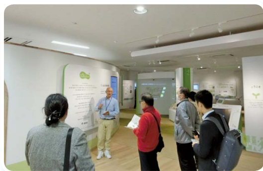
リプルンふくしま（富岡町）