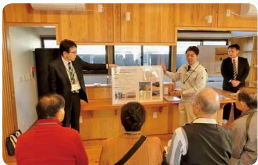
復興公営住宅・牛越団地（南相馬市）