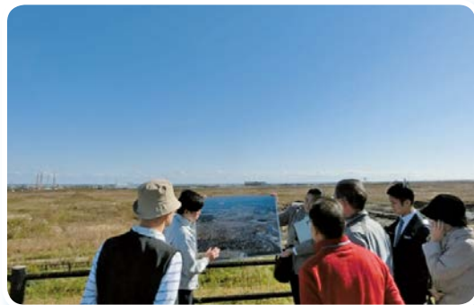
浪江町内（大平山霊園）視察