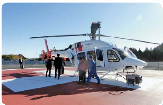
ふたば医療センター附属病院（富岡町）