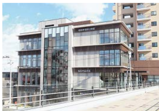
JR名取駅とはペデストリアンデッキでつながっています。

このうち北棟には東日本大震災で被災し、別の場所で仮設運営していた名取市図書館や、和室や調理室を備えた公民館などが入っています。