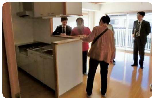
復興公営住宅・牛越団地（南相馬市）

●お問合せ先 東京都総務局復興支援対策部都内避難者支援課 ☎ 03-5388-2384