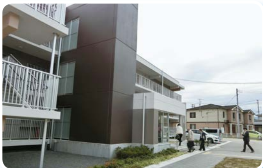
復興公営住宅 北好間団地視察（いわき市）

平成30年10月23日(火)に、ふるさと復興の今がわかるツアー【福島県南部コース】を実施し、いわき市・富岡町でふるさとの復興の様子をご覧いただきました。いわき市内の復興公営住宅・北好間団地では、福島県職員等の方に住居概要、敷地内に整備された診療所等の住環境、復興公営住宅でのコミュニティ形成支援等についてご説明いただき、住居内を見学しました。富岡町では、富岡町役場職員から復興状況をご説明いただき、町内を視察した後、平成30年4月に開院したふたば医療センター附属病院を視察しました。参加者の方からは、地元の様子を見ることができた、復興状況がよくわかった、早く帰還したくなったなどの声が寄せられました。