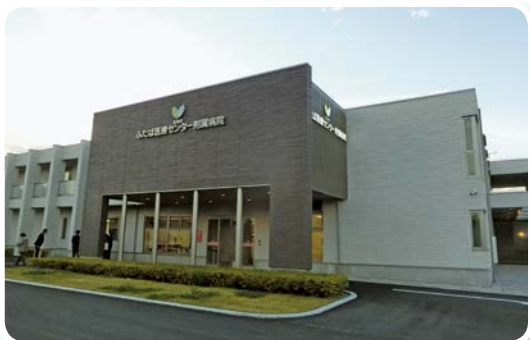
ふたば医療センター附属病院視察