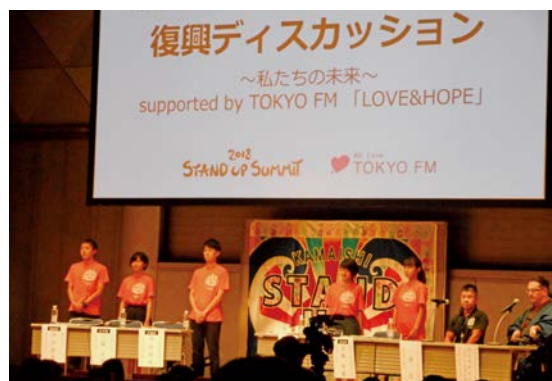
第二部復興ディスカッション

第二部で行われた「復興ディスカッション」では東京2020オリンピック・パラリンピック競技大会などをきっかけに、被災地への来訪者の増加が期待される中、復興を推し進め、より魅力的な観光地となるためには何をすればよいのか、参加学生の代表者とゲストによってそれぞれ異なる地域・立場から議論が行われました。