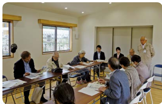
福島県職員等による説明（同団地）