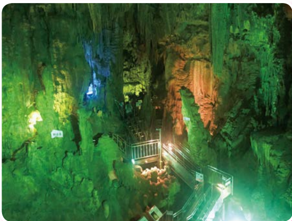
あぶくま洞（田村市で撮影）

福島県ではインフラの復旧等が進む一方、県外にはまだまだ多くの避難者がいらっやいます。避難されている皆さんが一日も早く安定した穏やかな生活が取り戻せるよう、残りの派遣期間も引き続き業務に邁進いたします。