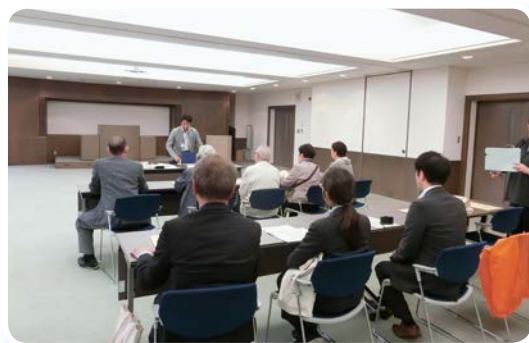
富岡町役場職員による復興状況説明