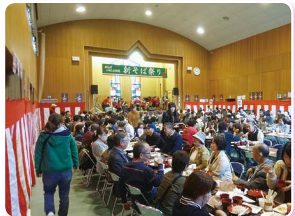
そば祭り（会津坂下町で撮影）