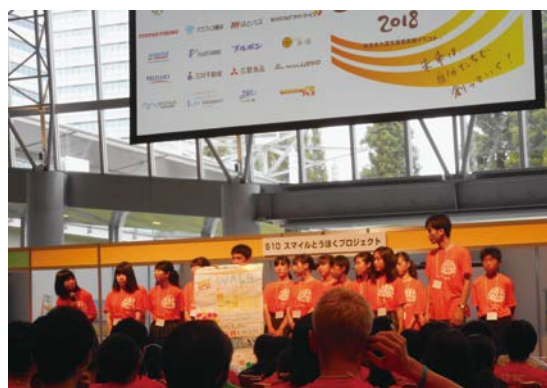
参加学生によるポスター発表

イベント第一部の「復興セッション」には300名以上の東北、東京、海外の中高生や大学生たちが参加しました。参加学生たちは、各協力企業や自治体などの復興への取り組みを学び、震災の風化防止や、これからの復興支援において「自分たちにできること」について議論を行いました。第一部の最後には学んだ内容をもとに現状の課題や解決策をポスターにまとめて、ステージ上で発表も行われました。地域や学年が異なる参加学生たちが自らの復興への思いをぶつけあい、非常に活発な意見交換が行われていました。