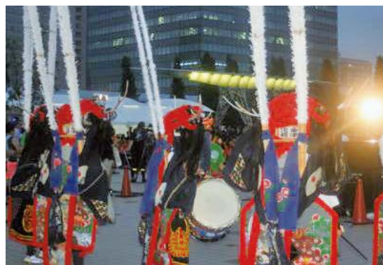
参加学生による伝統舞踊発表

また、前日の6日には同じく東京ビッグサイトにて「STAND UP FESTIVAL」が開催され、サミット参加学生によって、合唱やダンス、東北の伝統舞踊の発表が行われたり、参加学生を対象にワークショップが行われたりするなど、翌日のサミットに向け参加学生同士が交流を深めていました。