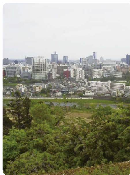
青葉山から見る仙台市街