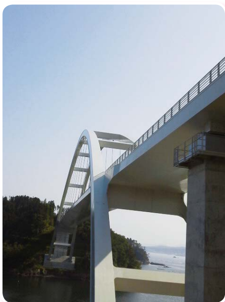
気仙沼市にある大島架橋

宮城県に派遣されて早くも半年余りが過ぎましたが、1日でも早い復旧・復興のため引き続き尽力してまいります。