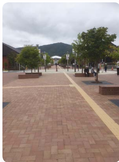
駅前商店街から見た女川駅