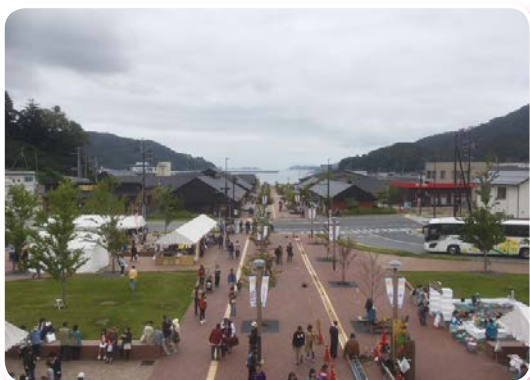
女川駅から見た商店街