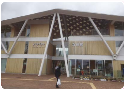
再建を果たした女川駅

私たちがこうしたイベントを体験し、宮城県の良さや復興状況を発信していきたいと思っております。