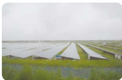
南相馬市内視察（メガソーラー施設）