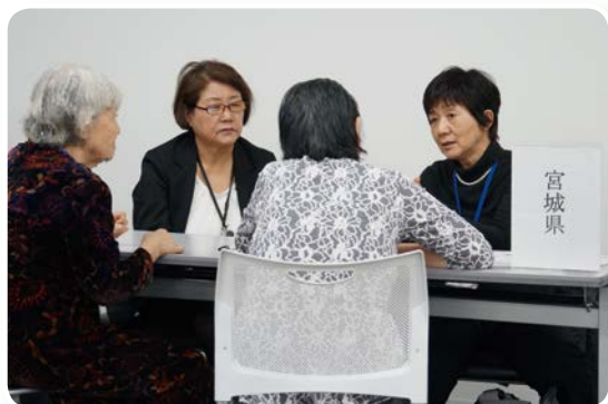
サロンでの宮城県相談ブースの様子

中でも最優先事項である被災者の生活再建に向けて、一人でも多くの方が故郷の「みやぎ」に帰れるようお手伝いをしていきますので、よろしくお願い致します。