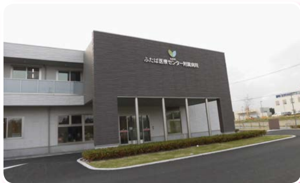
「ふたば医療センター附属病院」 平成30年4月11日撮影