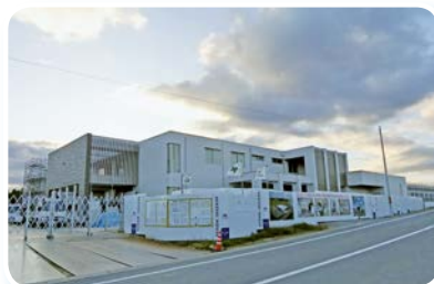
富岡町視察（ふたば医療センター附属病院）

平成29年11月21日～22日に実施し、6名の方と富岡町、楡葉町、広野町、いわき市、小名浜魚市場を視察しました。