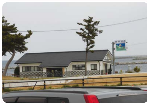
「原釜尾浜海水浴場」 平成30年4月11日撮影

福島県事務所は、派遣職員の生活環境・職場環境等を整えることで、復興支援活動を下支えする役割を担っており、引き続き現地常駐の利点を活かして、福島県の復興のために少しでもお役に立てるよう頑張っています。