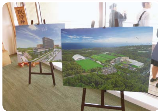
「Jヴィレッジ」内パネル 平成30年5月15日撮影