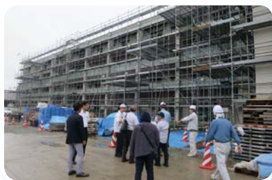
富岡町内視察（災害公営住宅建設現場）