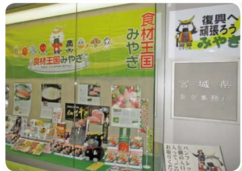
事務所入口の観光・物産PRコーナー 5月は「食材王国みやぎ」の展示

事務所には宮城県内の観光情報などのパンフレットも多数揃えておりますので、お気軽にお立ち寄りください。