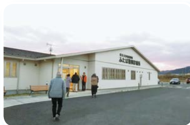
楡葉町視察（ふたば復興診療所）