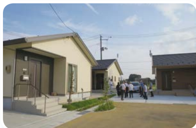
浪江町内視察（災害公営住宅）

平成29年8月29日～30日に実施し、8名の方と南相馬市、浪江町、富岡町、福島県水産試験場を視察しました。