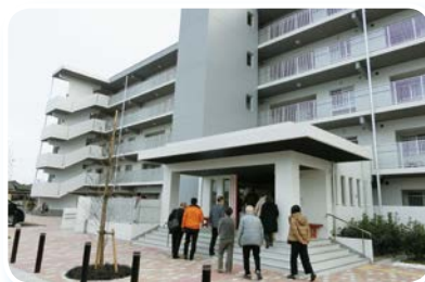
災害公営住宅視察（いわき市大原団地）