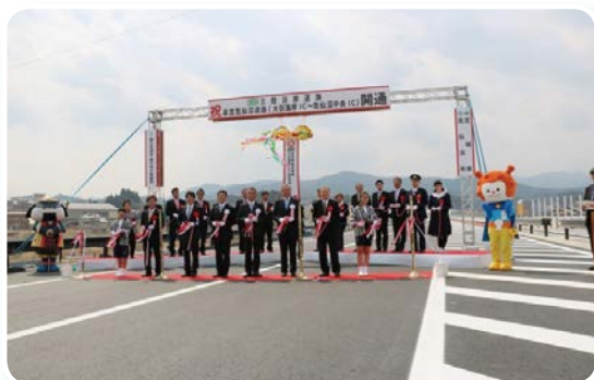
3月25日に開催された開通式