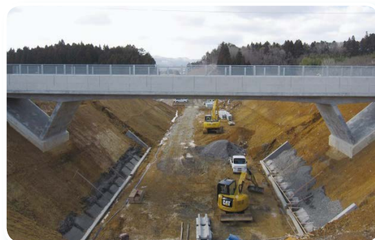
大谷海岸IC～本吉IC(仮)は今年度開通する予定