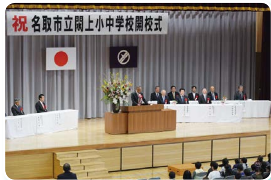
4月7日に行われた開校式の様子