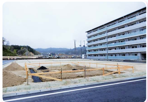
続々と建築工事が進んでいます（平成30年4月山田町にて撮影）