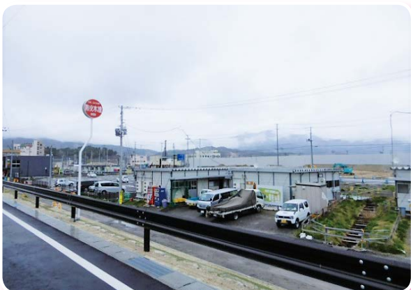
仮設商店街の様子（平成30年4月山田町にて撮影）

近年、大きな商業施設が沿岸部にも開業し、賑わいがみられるようになりました。それでも、支援を必要としている方々がまだまだたくさんいらっしゃいます。被災事業者の方々が一日でも早く事業を再開できるよう、そして岩手県の目指す「なりわいの再生」が一步でも前に進むよう、微力ではありますが、私も貢献できたらと思っています。