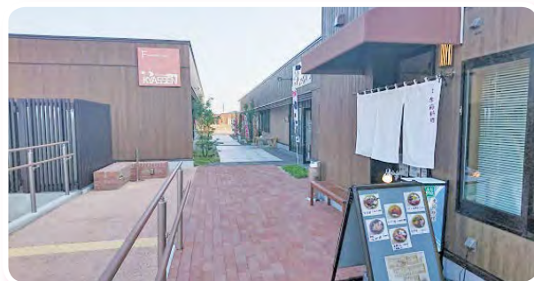
キャッセン大船渡 東京ではお目にかかれない海の幸が楽しめる。