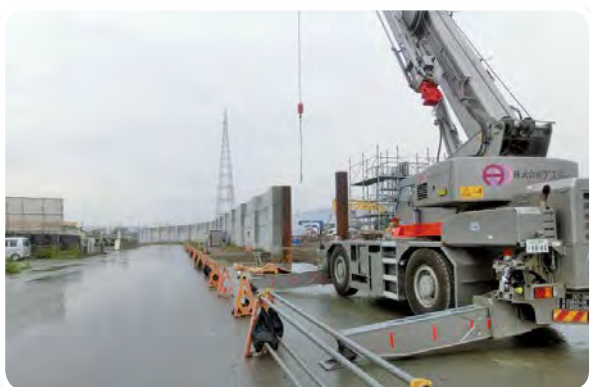
整備進む商港岸壁の防波堤(気仙沼市)