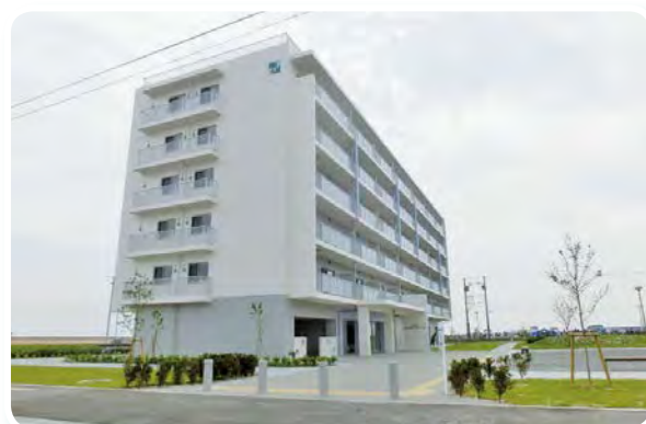
名取市高柳地区に完成した災害公営住宅