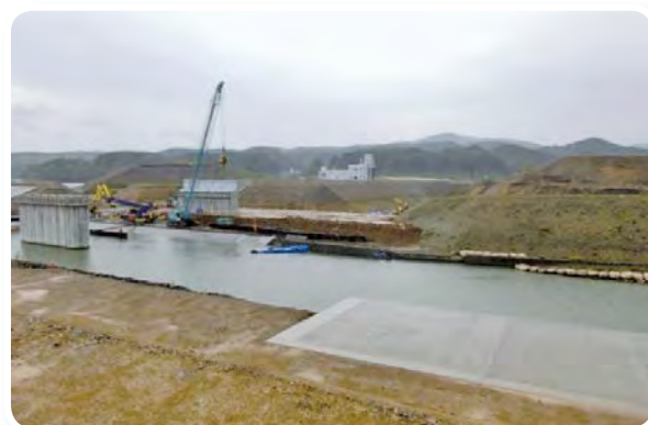
かさ上げ工事が進む南三陸町