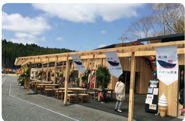
今春オープンした歌津地区商店街『南三陸ハマレ歌津』