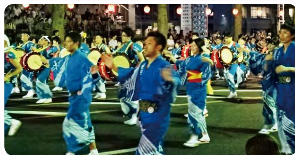
盛岡の夏といえば「さんさ踊り」 私も太鼓隊として参加しました