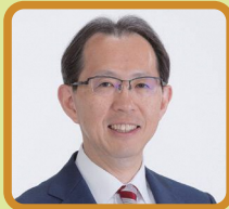
福島県知事 内堀 雅雄