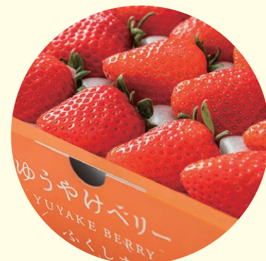
ゆうやけベリースイーツ登場!