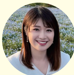
MC: 幡谷明里 (フリーアナウンサー)