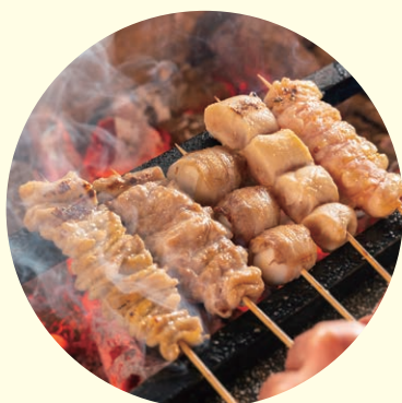
ふくしまの美味しいグルメも 盛りだくさん