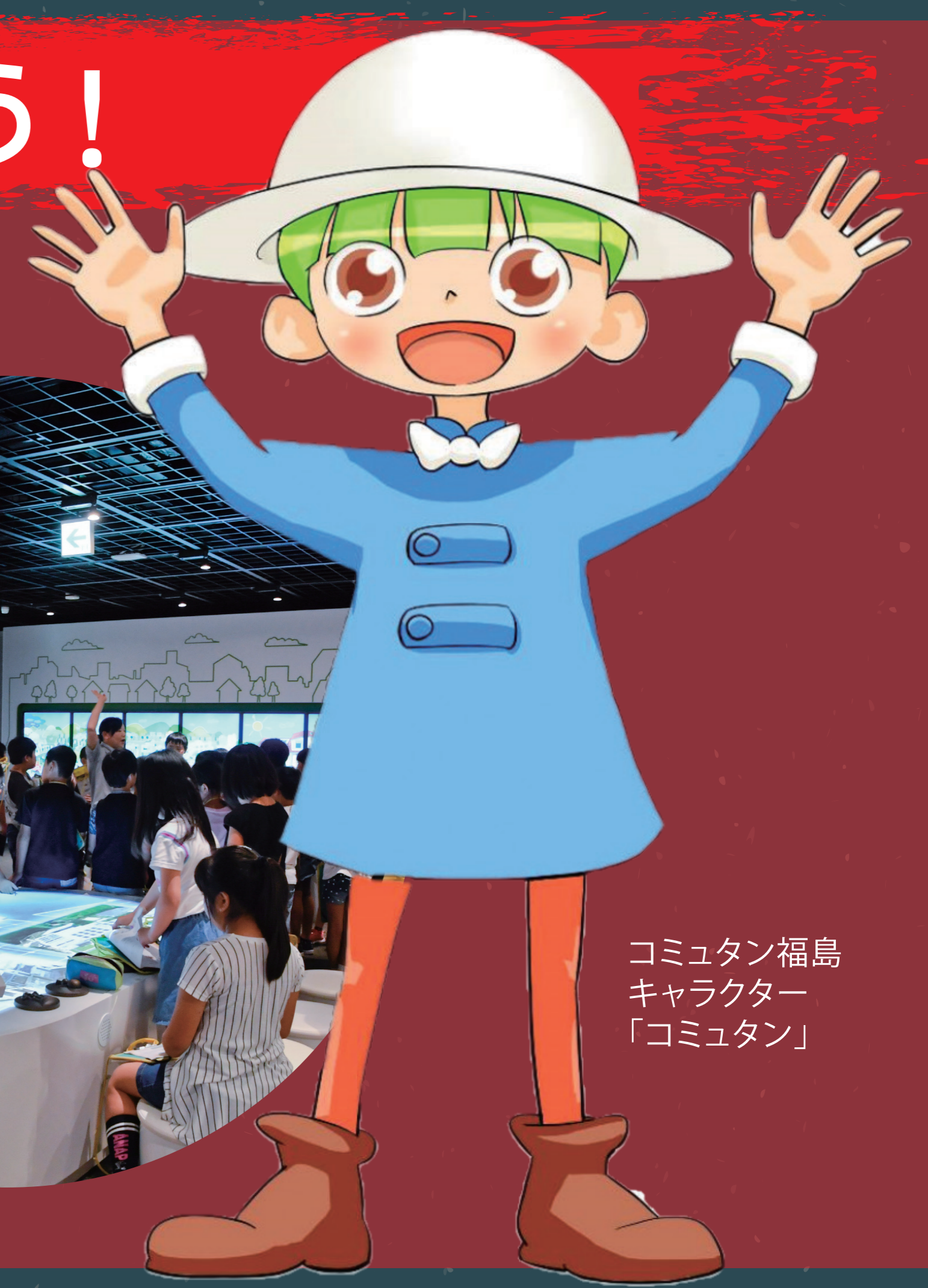
コミュタン福島キャラクター「コミュタン」