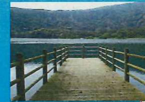
南側棧橋からの眺め