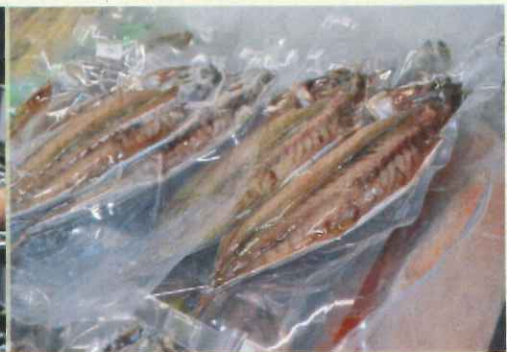
冷風乾燥機を活用して新しい加工品（干物）を開発しています！