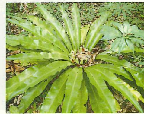
オ オ タ ニ ワ タ リ