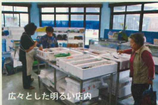
広々とした明るい店内