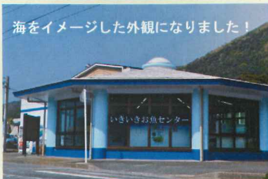
海をイメージした外観になりました！

錆が浜港入口、『いきいきお魚センター』は、無休で午前10時から午後3時まで営業しています。