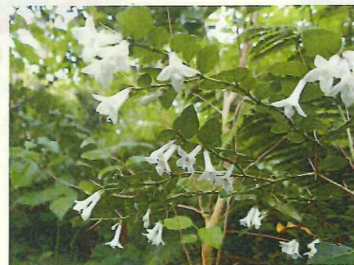
ア リ ド オ シ

大路池周廻線道路は、平成26年度に東京都三宅支庁にて整備した遊歩道である。大路池の周囲約2キロにわたる遊歩道であり、四季を通じて様々な野鳥を観察することができる。また、緑豊かな照葉樹林を散策しながら、大路池の水辺近くまで遊歩道が整備されているため、三宅島の大自然の息吹を感じることができる。