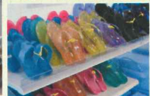
三宅島産の魚介類だけでなく、島内産野菜や人気の土産品も買うことができます！