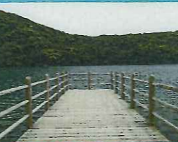
北側棧橋からの眺め