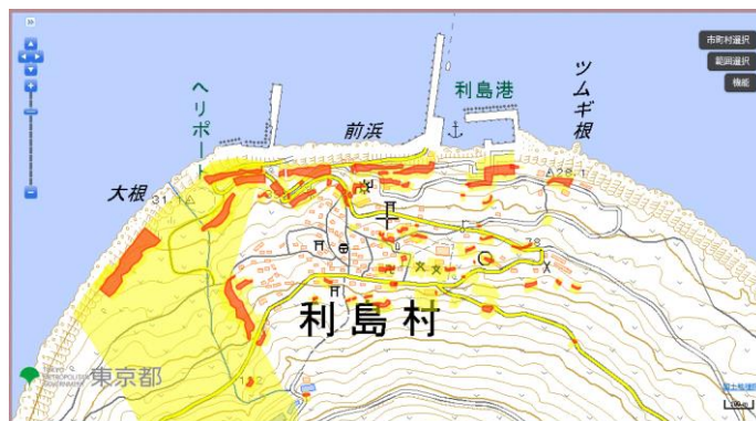
土砂災害警戒区域等マップ

皆さまのご自宅や生活圏が、区域に含まれているかを事前に確認し、避難の判断に役立ててください。