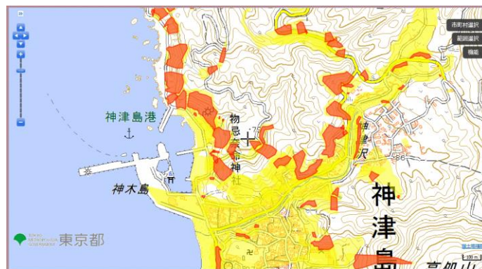
土砂災害警戒区域等マップ