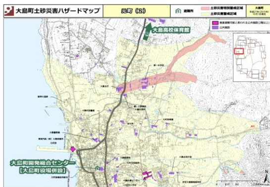
土砂災害ハザードマップ