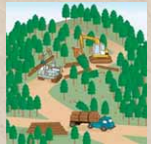
適切に森林整備を推進！

ことから、森林の土地の所有者の把握を進めるため、平成24年4月から森林法に基づく森林の土地の所有者となった旨の届出制度が創設されました。なお、この届出により、森林の土地の所有権の帰属が確定されるものではありません。