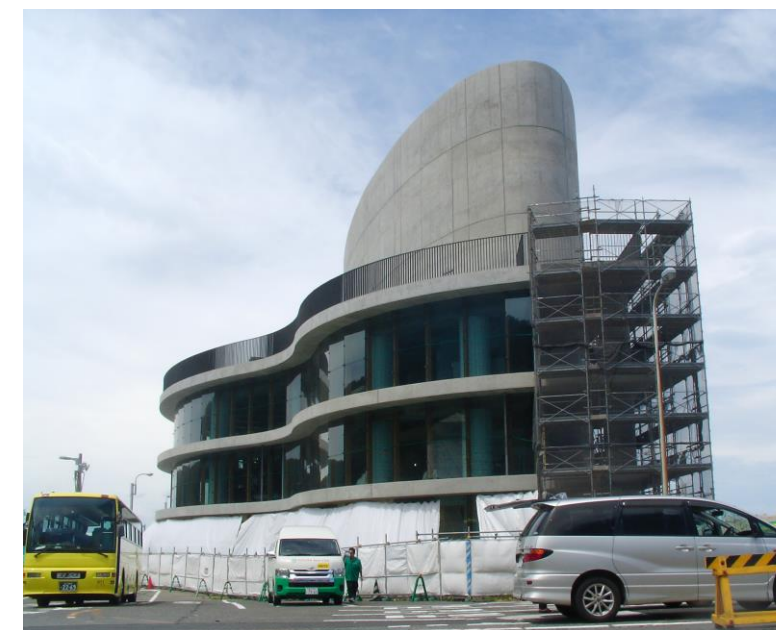
写真-4 船客待合所及び津波避難施設外観

現在は、仮設足場が取り払われ、流線型の外観が露わになってきました。引き続き内装や設備工事などを進めている段階です。津波避難通路についても、本年度分の工事が契約となり、建設を開始しております。完成後に外構工事(暫定)を行い施設の運用を開始する予定です。