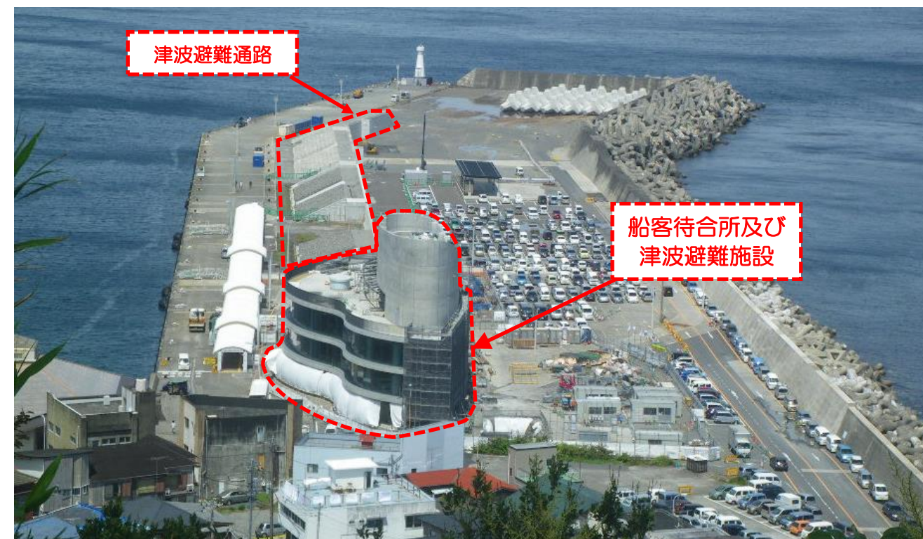
写真-5 岡田港の施設状況

発行：大島港湾空港管理事務所 TEL：04992-2-1400 大島支庁港湾課工事担当 TEL：04992-2-4461