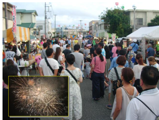
写真-1 元町仲通りの賑わい

8月11日(土)、12(日)の2日間元町仲通りにおいて「2018伊豆大島夏まつり」が開催されました。これは、来島されたお客様と島の人達と一緒に楽しめるイベントとして、毎年お盆の時期に開催されているお祭りで、今年も各団体によるバンド演奏やミス大島発表会などで盛り上がりしました。大きな見どころのひとつは11日21時からの花火大会、元町港棧橋から打ち上げられる約1000発の花火が大島の夏の夜を彩りました。