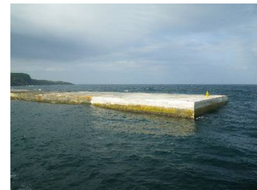
上部工コンクリート打設終了