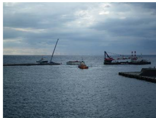
ケーソン据付状況

波浮港では今年度、ケーソン据付を実施し平成29年6月15日に据付が完了しました。ケーソンは、延長25m、幅24.6m、高さ5.515tの大きなケーソンでした。このケーソンは、港内の静穏度を高め、定期船の就航率向上に大いに役立つものとされています。ケーソン据付後は、海底部の根固め・被覆ブロックの据付や、上部コンクリートの打設が行われ、平成29年2月中の完成を目的に工事を進めております。