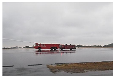
消火救難訓練（化学消防車による消火）