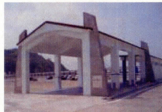
ぬいねえどう(外観)

「ぬいねえどう」は、船舶の乗降の快適性、利便性を図るとともに、貨客動線の分離による歩行者の安全性を確保することを目的として整備されたものです。