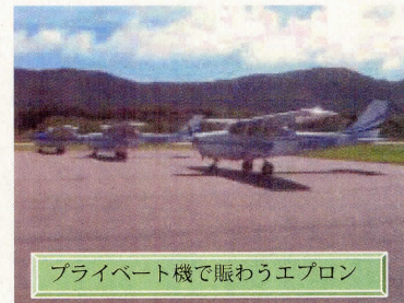
プライベート機で賑わうエプロン

発行：新島港湾空港管理事務所 TEL.04992-5-1267 FAX5-1537 新島港湾空港工事事務所 TEL.04992-5-0086 FAX5-0287