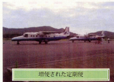
増便された定期便

天候に恵まれたおかげで、今年8月の就航率は良好で、定期便の欠航は5便しかありませんでした。また、この時期はプライベート機の予約も多く、駐機できるエプロンがいっぱいになってしまう日も多くありました。