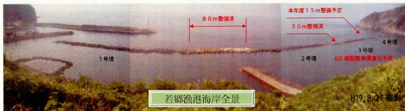
若郷漁港海岸全景

来年度の事業予定については、先の台風等の影響で既設離岸堤の2号堤～4号堤の一部で飛散や沈下した箇所があるため、新たに消波ブロックの製作据付を実施し、低下した離岸堤機能の復旧を行います。