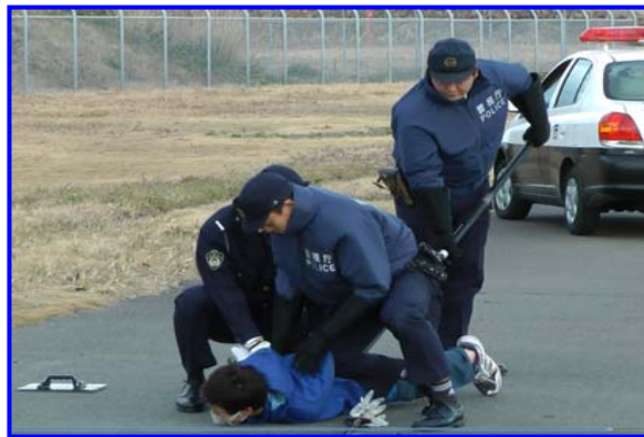
警察官により制圧完了