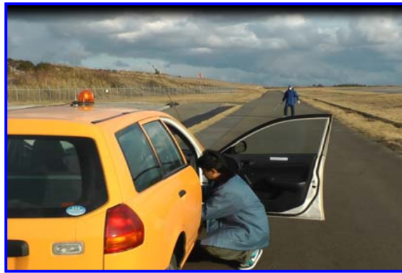
空港職員が状況確認