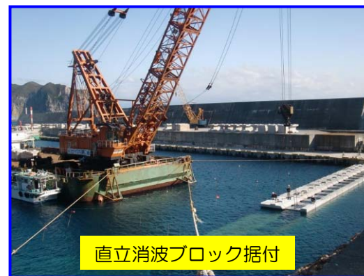
直立消波ブロック据付