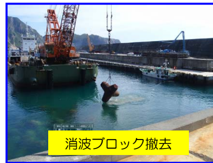
消波ブロック撤去