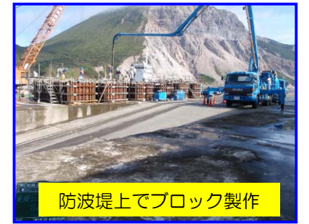
防波堤上でブロック製作