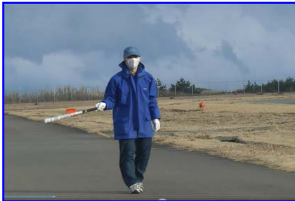
制限区域内に不審者侵入!!

今後もこのような訓練を定期的に行ない、空港の安全確保及び緊急対策の習熟に努めていきます。