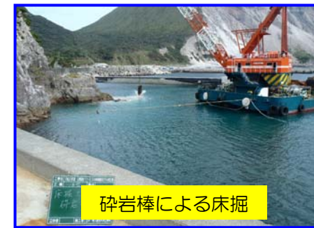
砕岩棒による床掘