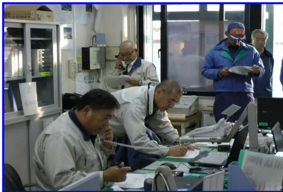
関係機関へ緊急連絡