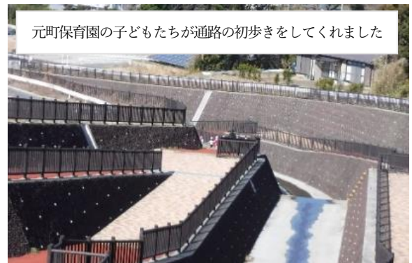
写真2 通路部と最初の利用者