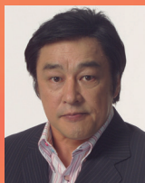
横田 滋：原田大二郎