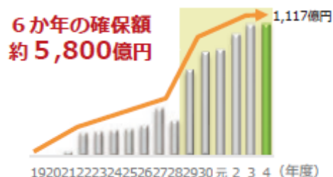
財源確保額の推移