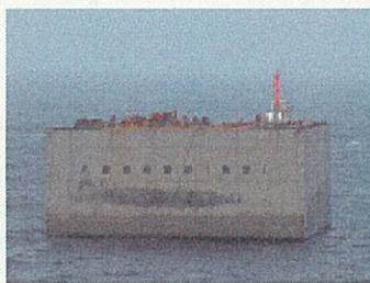
幅27.5m×23.0m 高さ18.0m 重量5,270トン

は台風6、7号の影響により、八重根漁港と八重根港のケーソン据付が遅れました。しかし、周