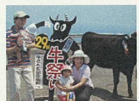
牛さんと記念写真

今年も8月10日に開催された青ヶ島の牛祭り。青ヶ島では、青と原料のさつまいも、ひんぎや耐の生産のほか、花き園芸品も年々生産量が増え、祭りの品評会では、数多くの力作や優良作品が出品されました。