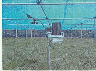
ハウス内の観測機器

が、5月14日から7月4日までの52日間を見ると、風速は、表のとおり期間を通じた平均値で、屋外に比べハウス内の方が50%も少なくなるデータが得られ、瞬間最大風速も約40%減少し、ハウスの減風効果が非常に大きいことが分かりました。