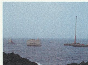
東京港から八丈島へ

漁港に1函、洞輪沢漁港に1函の合計4函のケーソンを据え付けました。八重根港の1函目は6月26日、洞