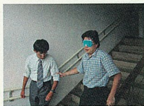
福祉教育研修の様子