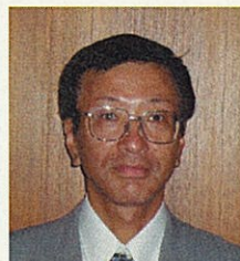
八丈支庁長 山手 秀雄

八丈町並 びに青ヶ島 村の皆様は、日頃か ら東京都の 事業執行に当たり、ご理解とご協力をいただき厚く感謝申し上げます。