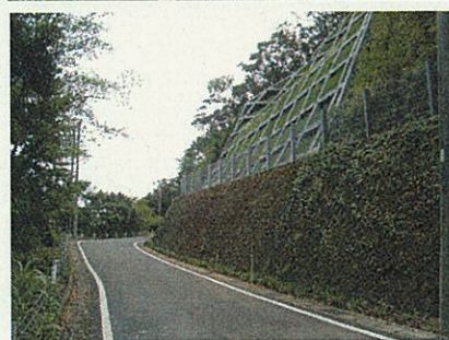
(上) 災害後 (下) 復旧後

し、皆さんが知りたい情報や、私たちが皆さんにお知らせしたい情報を発信できるようにするためです。