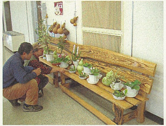
八丈島空港のスギのベンチ